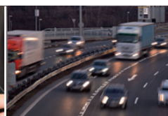
Logistik in Ballungsräumen