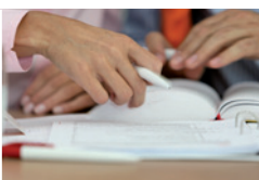
Bildung und Wissen